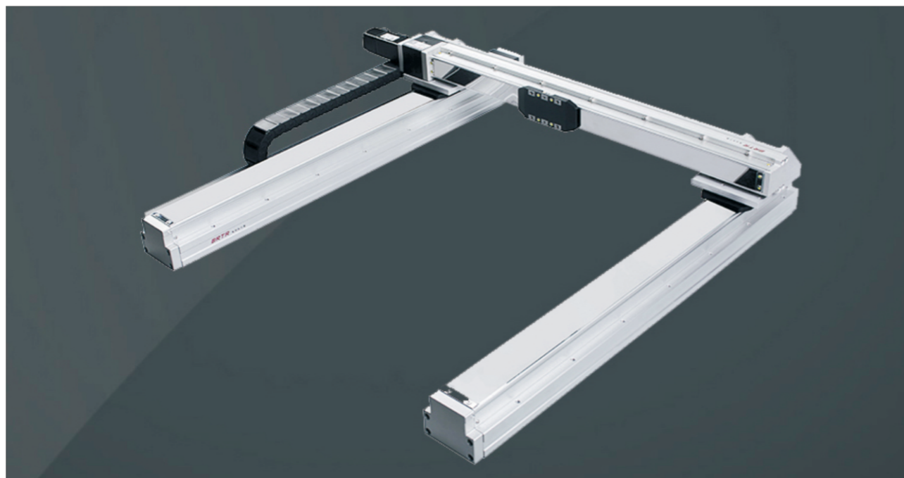
此图仅供参考, 出货规格详见尺寸图面 The picture is just for the reference. Please check the actual dimensions on the drawing.